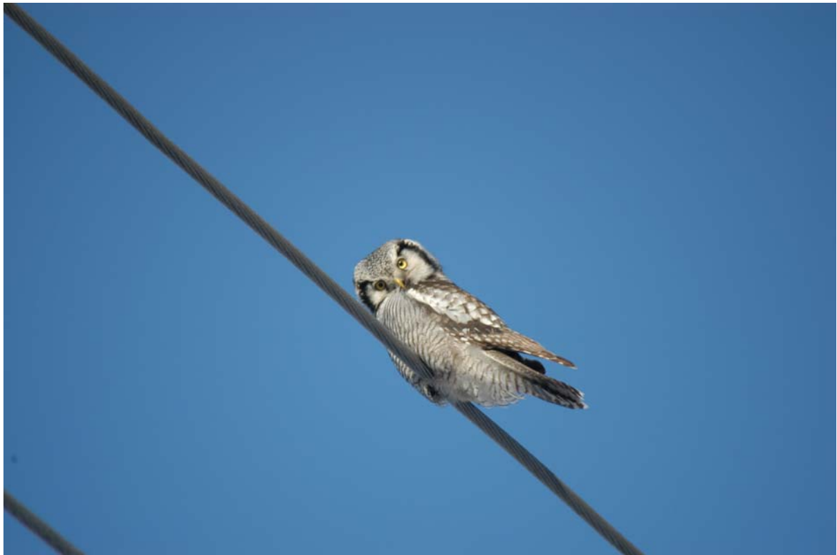
Haukugle (Surnia ulula) ved Skrøytnes, Sør-Varanger