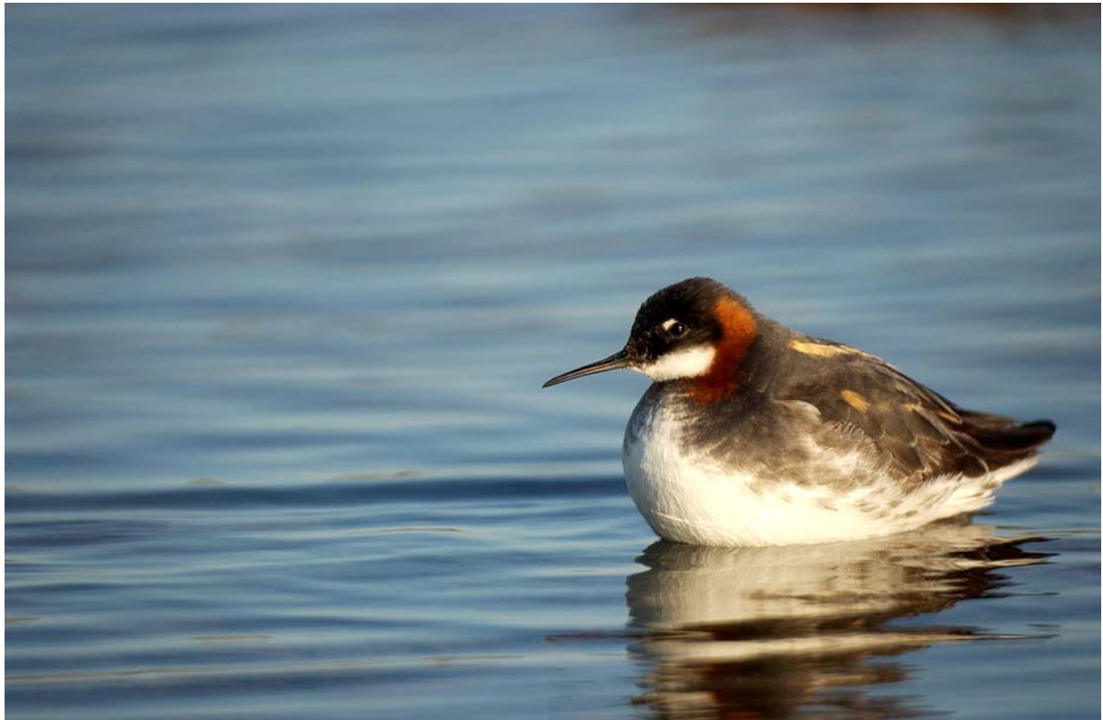
Svømmesnipe ( Phalaropus lobatus ) ved Salmijärvi – Foto © Ragnar Våga Pedersen 2003.

Vi håper også at økt ornitologisk aktivitet i området kan bidra til ny kunnskap om fuglelivet i området. Sannsynligvis er det enda flere arter som benytter området enn de vi har registrert fram til nå.