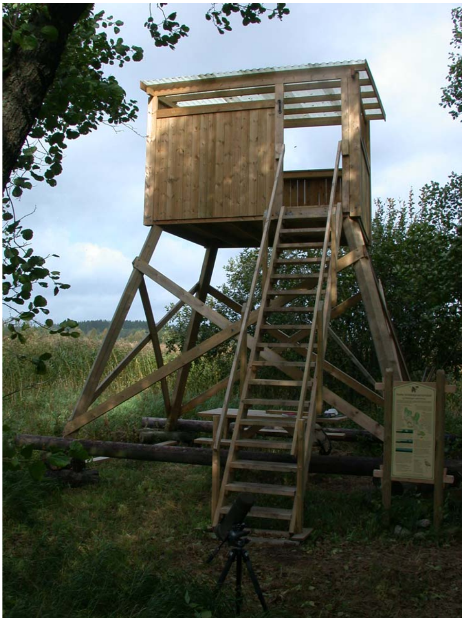
Fugletårnet ved Rokkevannet, Halden – Foto © Morten Günther 2003.

Fugletårnet vil etter all sannsynlighet bli reist ved observasjonspunkt B – like nord for Lille Skogøy, og det vil bli innviet i løpet av sommeren 2004. Tårnet er planlagt på bakgrunn av et nylig oppført fugletårn ved Rokkevannet i Halden (Østfold), og forhåpentligvis vil det bli til glede for både lokale og tilreisende ornitologer, skoleklasser og andre naturinteresserte.