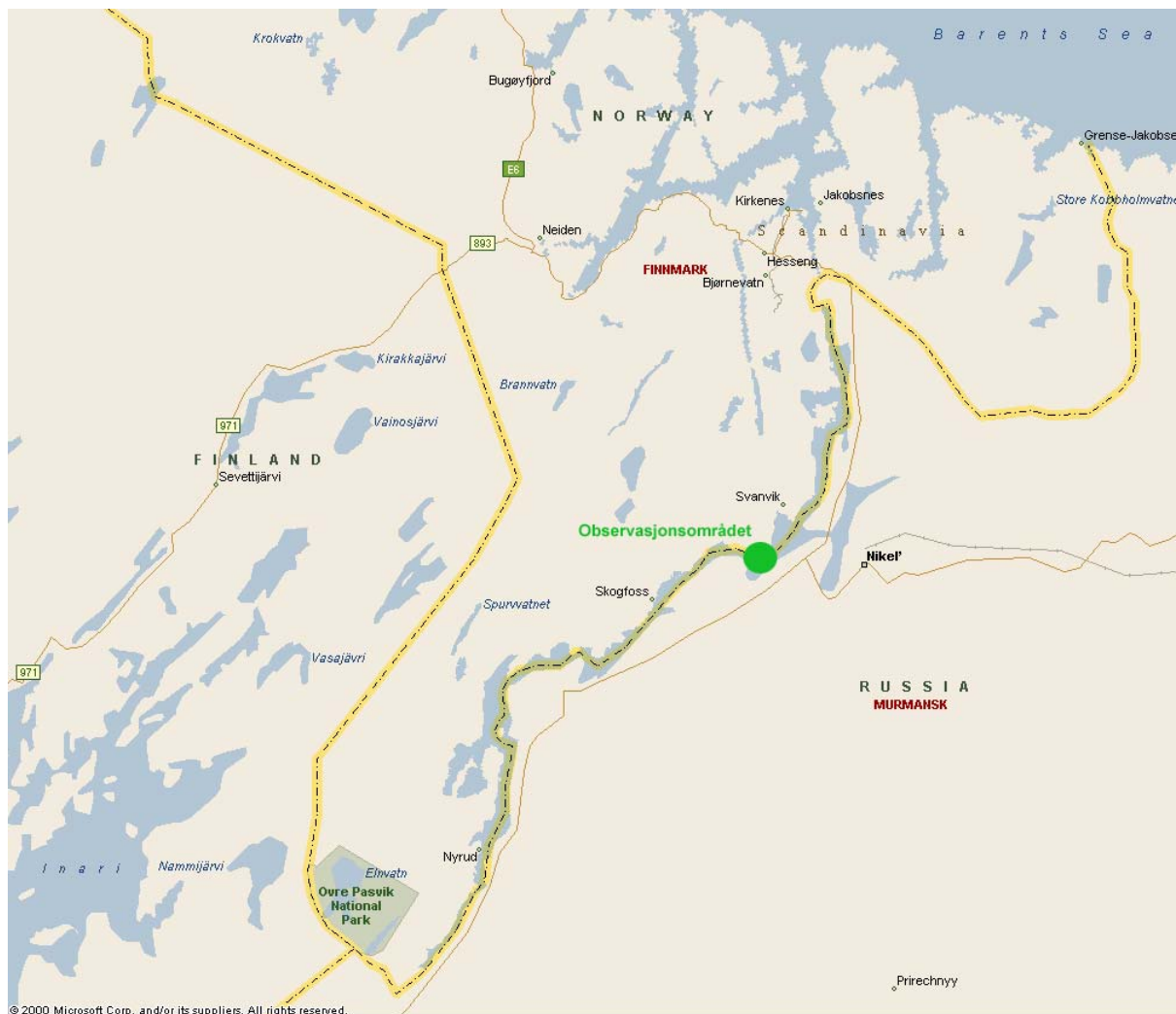
Figur 1. Kart over Sør-Varanger kommune og de tilgrensende delene av Inari og Petsjenga kommuner.

Skrøytnes-Mennika ligger godt utenfor Pasvik naturreservat, og har pr. i dag ikke noe særskilt vern mot framtidige inngrep. Dette til tross for at området trolig er et av de mest interessante i hele Pasvikdalen. Området huser flere arter av sjeldne hekkefugler, bl.a. sædgås, fjellmyrløper, dvergmåke og trane. Fortsatt overvåking og kartlegging av fuglefaunaen i dette området vil ytterligere kunne dokumentere lokalitetens verneverdi og eventuelt danne grunnlag for en fremtidig utvidelse av Pasvik naturreservat lengst nord mot Pasvik zapovednik.